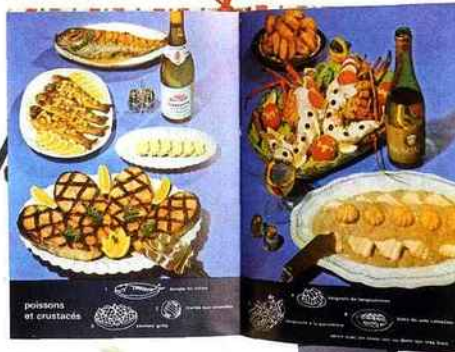
poissons et crustacés