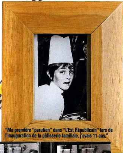
"Ma première 'parution' dans 'L'Est Républicain' lors de l'inauguration de la pâtisserie familiale, j'avais 11 ans."