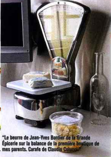
"Le beurre de Jean-Yves Bordier de la Grande Épicerie sur la balance de la première boutique de mes parents. Carafe de Claudio Colucci"