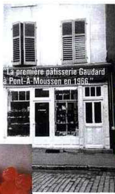
"La première pâtisserie Gaudard à Pont-A-Mousson en 1966"