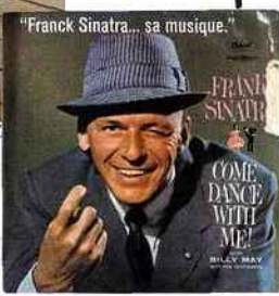
"Franck Sinatra... sa musique."