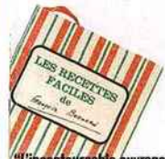
"L'incontournable ouvrage de cuisine de Françoise Bernard, nous concoctons actuellement ensemble un livre de desserts."