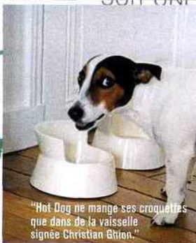
"Hot Dog ne mange ses croquettes que dans de la vaisselle signée Christian Ghion."

Enfant, ma pâte à modeler était de la pâte d'amandes.