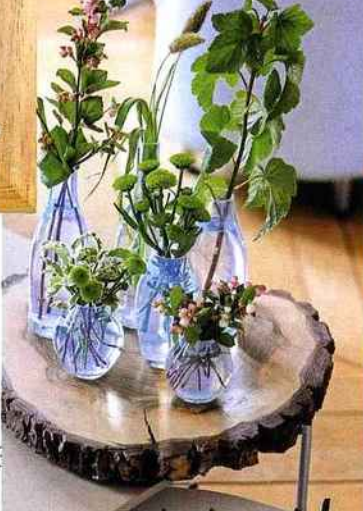
"Les 'vases des 7 jours', création à l'image de l'univers bucolique des Tsé & Tsé."